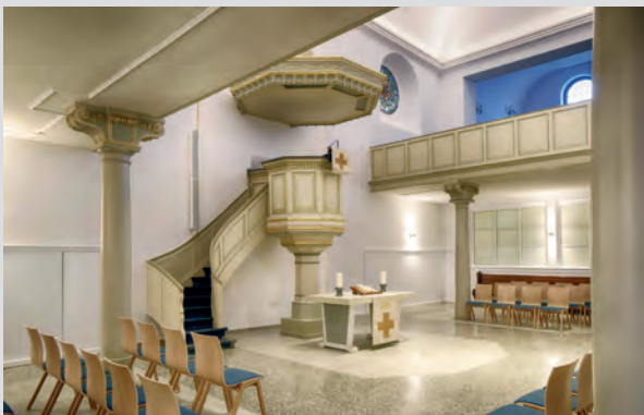
Der Innenraum der Marienkirche.