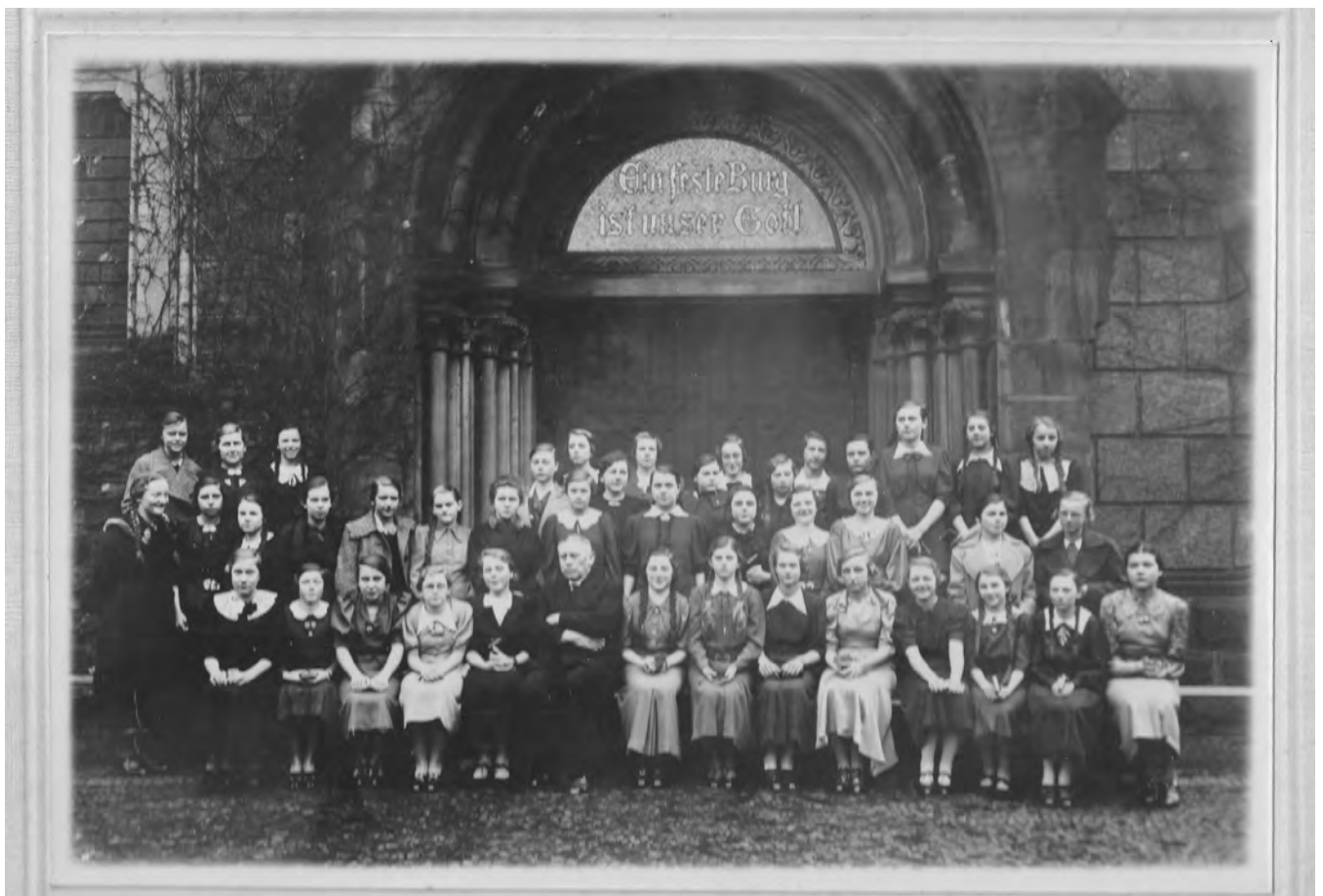
Dieses Konfirmations-Foto entstand am 14. März 1937 vor dem Eingang der Lutherkirche.