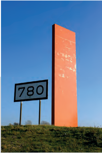
„Rheinorange“ bei Rheinkilometer 780