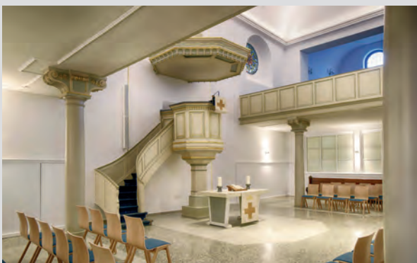
Der Innenraum der Marienkirche.