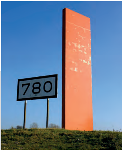
„Rheinorange“ bei Rheinkilometer 780